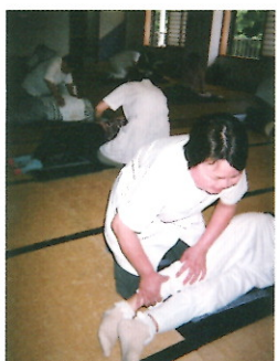
心を込めてマッサージ

六月十八日甲府鍼灸マッサージ会が相川福祉センターを利用する方々へマッサージ奉仕を行いました。青い鳥ホームの皆さんも休日を返上しての参加となりました。ホームの皆さんは一人でも多くの方々に本物のマッサージの良さを知っていただくとうと心を込めての奉仕活動でした。