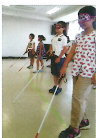
白い杖で歩いてみました

し、目の不自由な方をより身近に感じていただき、理解と協力を深めてもらえればと思います。