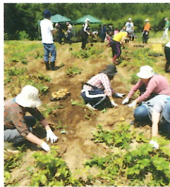
いっぱい採れるかな

今回も、地域のボランティアの方々や在宅の児童さんやその保護者の方々、成人寮の利用者さんとご一緒出来て、よい交流になりました。回を重ねる毎に参加者が増え、次回が楽しみです。