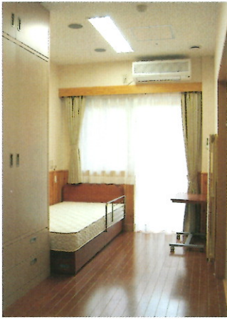
全個室でエアコン完備

ご利用方法等、ご不明な点がありましたら、下記までお問い合わせください。また施設見学も随時受け付けております。