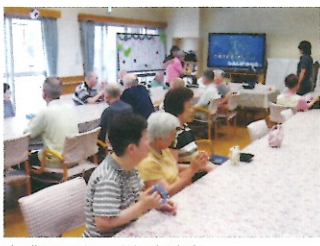
大盛況のカラオケ交流会

今年度より青い鳥老人ホームでは、最新のカラオケ機器を導入し、月に一回「カラオケ交流会」を始めました。普段「人前で唄うのは…」と歌謡クラブに参加しない利用者にも参加しやすい様、職員とのデュエットを勧めたり、職員が歌声を披露したり、参加者全員で合唱したりと普段の歌謡クラブとは趣向を変えた会となっています。また第二回より施設長賞が用意され、ますます楽しみな会となっています。どなたが受賞するかは施設長の御心次第!