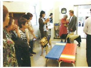
青い鳥成人寮の見学をするモニターの方々