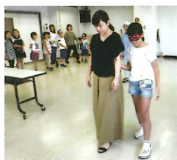
お母さんを信じて