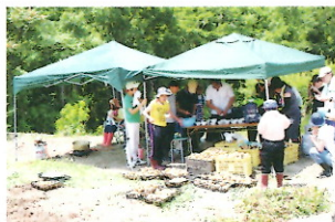
ジャガバターおいしいね

更に、ビニール袋に「ジャガイモ詰め放題！」の企画でも、「もつと入るかな?」「これが大きいよ」などと、皆さん楽しんで詰めていました。ケアホームの食事に持ち帰ったり、短期の方はお家へのお土産にしています。