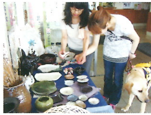
利用者の作品を手にとって鑑賞

鳥ケアホームと盲人福祉センターを見学頂き、新機種プレクストークの体験、また、モニター通信においてお寄せ頂いたご意見を中心に、開催する予定です。