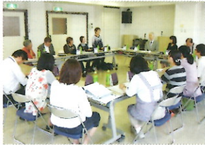
モニターの方々との意見交換

鳥ケアホームと盲人福祉センターを見学頂き、新機種プレクストークの体験、また、モニター通信においてお寄せ頂いたご意見を中心に、開催する予定です。