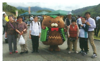
ゆるキャラ「やはたいぬ君」と一緒に

五月十四日甲斐市クラインガールテンふるさと梅の里祭りに参加しました。いつも山梨ライトハウスにご協力をお願いしている甲斐市の方々と合流し、ワインやトン汁、焼き鳥をいただきました。