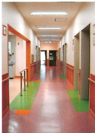
廊下に設置されている点字ブロック