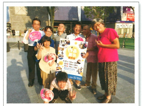
ウツェタウン6丁目出演