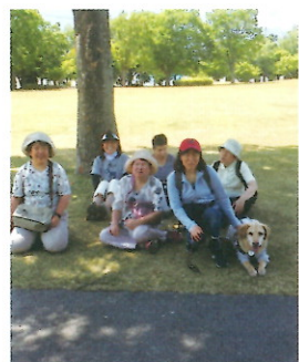
公園の木陰で一休み

えていただきました。先ずは手を伸ばして届くところから食べ始めました。「甘くて美味しい」とみるみる数本の木を食べつくす勢いでした。盲導犬のプロもちゃっかり一粒味見をするというハ、ピングも、さぞ美味しかったことでしょう。食事後はお腹ごなしに近くの公園内を散策して帰路につきました。