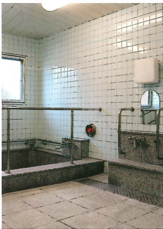
温泉で心も身体も癒されます