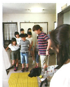
盲導犬の体験をしました