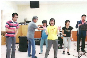
みんなで歌いました