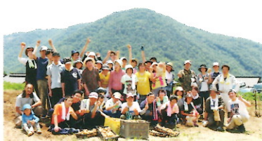
「ジャガイモはおいしい〜」の合言葉で記念撮影

今回も、地域のボランティアの方々や在宅の児童さんやその保護者の方々、成人寮の利用者さんとご一緒出来て、よい交流になりました。回を重ねる毎に参加者が増え、次回が楽しみです。