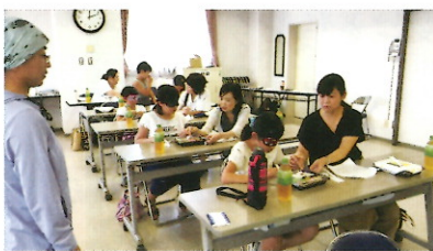
食事はアイマスクをしていただきます